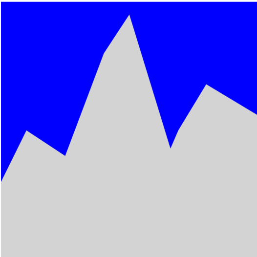
Gebirge und blauer Himmel